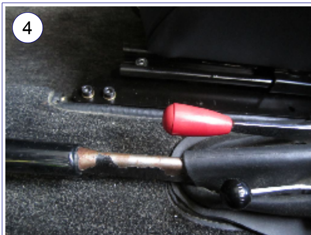
Detail Befestigung vorn