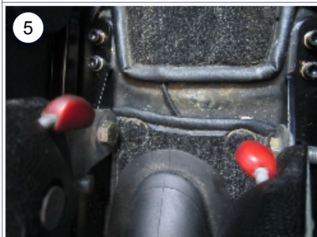
Detail Befestigung hinten